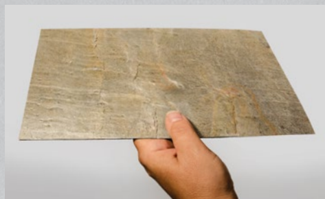
Materialstärke 1,5–2 mm

Durch den Verarbeitungsprozess erhält das Furnier sowohl Stabilität als auch die gewünschte Flexibilität. Es erscheint mal matt, mal glänzend oder mit Glitzereffekten, je nach Schiefertyp.